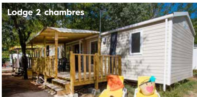
Lodge 2 chambres

Taxe de séjour par personne majeure et par jour : 0,60 €