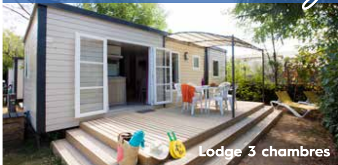
Lodge 3 chambres