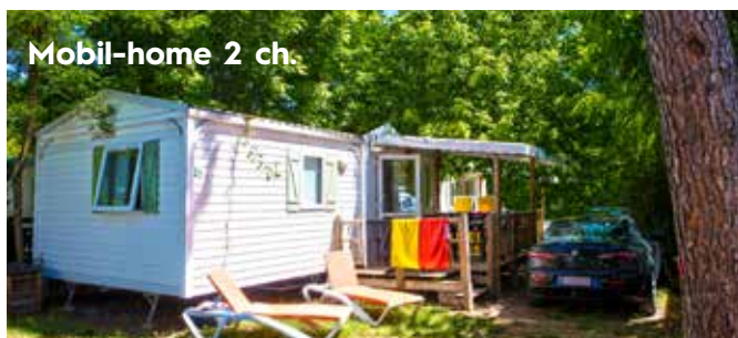
Mobil-home 2 ch.

Taxe de séjour par personne majeure et par jour : 0,60 €