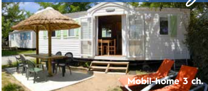
Mobil-home 3 ch.